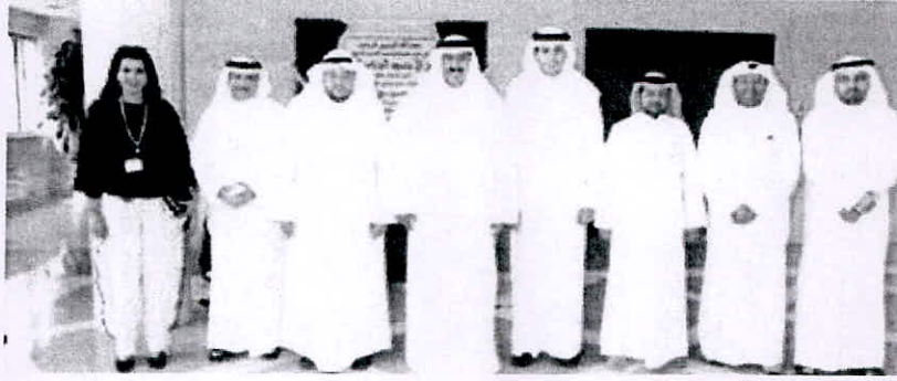
المصنف يتوسط اعضاء الإنشائي

التدريب الإنشائي وصباح السالم والعالى للخدمات الإدارية، بمديري المعاهد ومساعدتهم ورؤساء الأقسام العلمية والتدريبية، وأعضاء اللجنة العلمية، واستمع خلال اجتماعه بهم إلى بعض المقترحات التي من شأنها تيسير العملية التعليمية والتدريبية والنهوض بها.